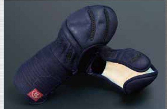
冠 至極甲手 :KJ103 79,000円+税