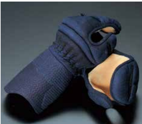
冠1.8分カムムリ刺B 武州紺織刺・紺革 KK1823 58,800円+税 手の内茶鹿革 サイズ:L・M・S