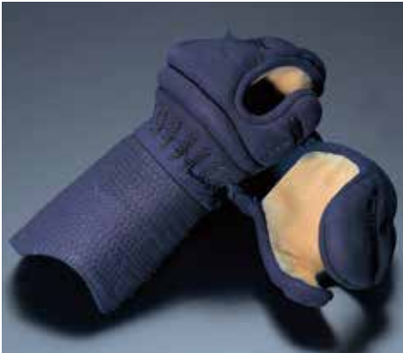
冠1.8分カムムリ刺A 総紺革 KK1813 82,000円+税 手の内茶鹿革 サイズ:L・M・S

使いやすさと安全性を兼ね備えた、 実戦型シリーズ。 (セット掲載:P6~P15)