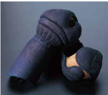
冠1.5分手刺総紺革 KT1513 129,200円+税 手の内茶鹿革・鹿毛入り サイズ:L・M・S