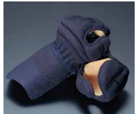
冠1.8分カムムリ刺D 総人工紺革 KK1843 43,600円+税 手の内東レ茶ウルトラエード サイズ:L・M・S