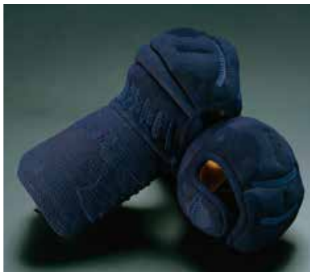
冠1.5分手刺織刺 KT1523 84,000円+税 手の内茶鹿革 鹿毛入り サイズ:L・M・S 冠2.0分手刺織刺 KT2023 80,900円+税 手の内茶鹿革 鹿毛入り サイズ:L・M・S