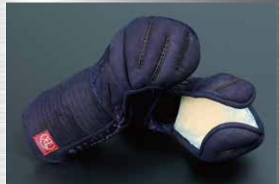
冠 実戦型甲手 :KJ203 79,000円+税