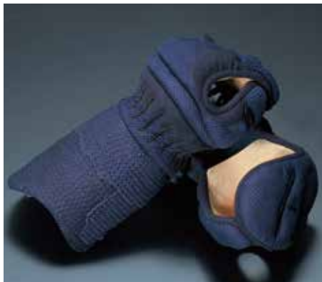
冠1.8分カムムリ刺C 織刺・人工紺革 KK1833 39,900円+税 手の内東レ茶ウルトラエード サイズ:L・M・S