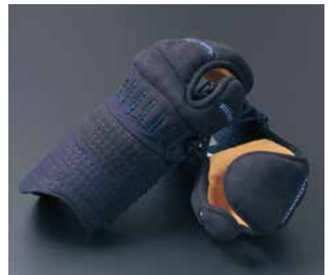
冠7mmカムムリ刺少年用 KM7003 34,600円+税 手の内東レ茶ウルトラエード サイズ:少L・少M