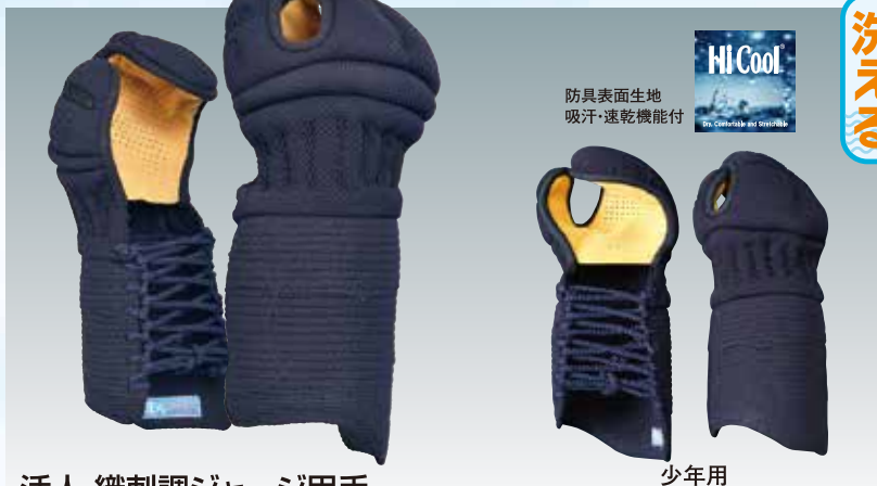
活人 織刺調ジャージ甲手

大人用(446) 25,800円+税 サイズ:LL・L・M・S (LLは(446LL) 28,400円+税 )